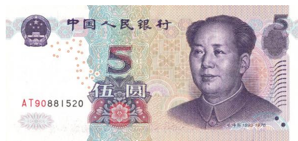
5 yuan Rmb