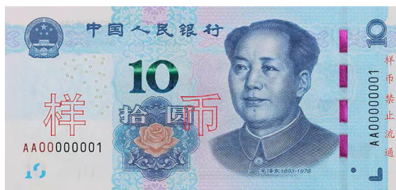
10 yuan Rmb