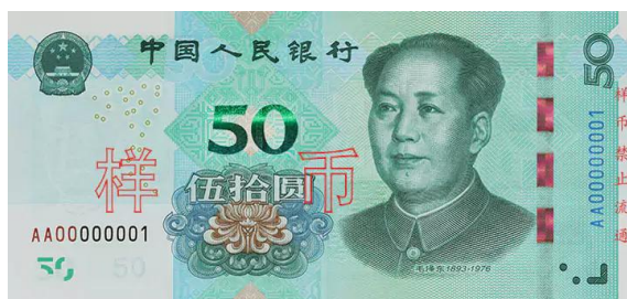
50 yuan Rmb