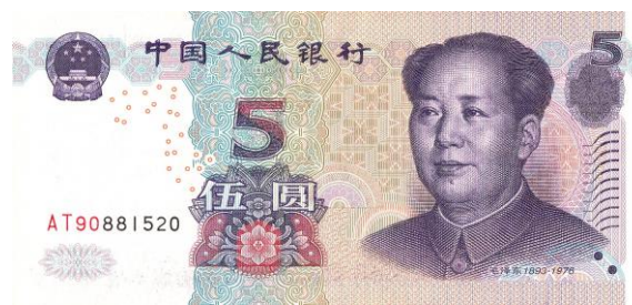
5 yuan Rmb