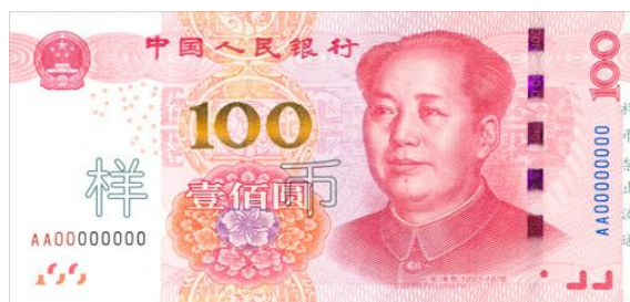
100 yuan Rmb