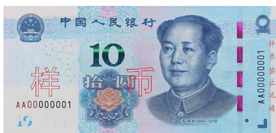
10 yuan Rmb