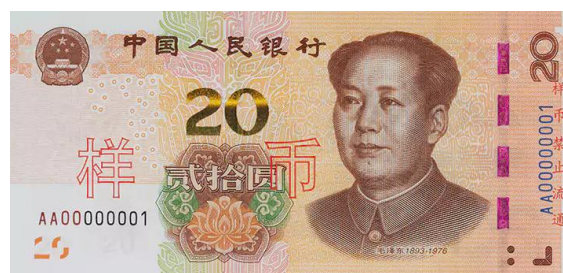
20 yuan Rmb