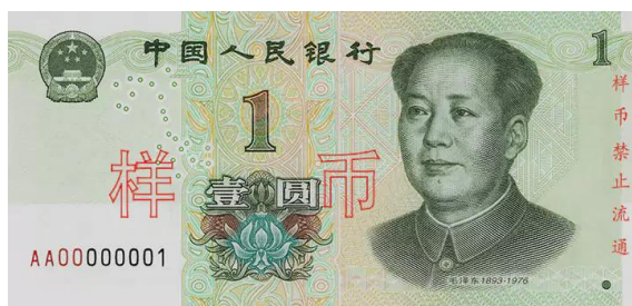
1 yuan Rmb