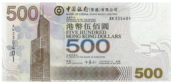
500 dólares Hong Kong