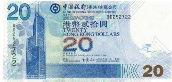
20 dólares Hong Kong