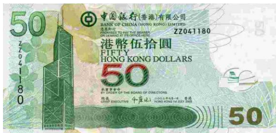
50 dólares Hong Kong