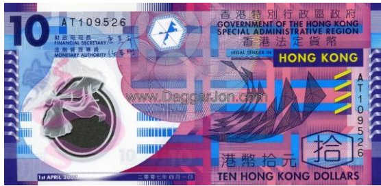
10 dólares Hong Kong