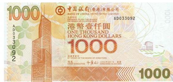
1,000 dólares Hong Kong