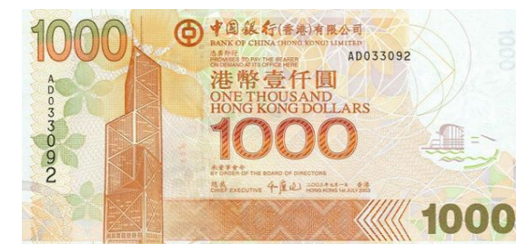
1,000 dólares Hong Kong