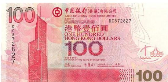
100 dólares Hong Kong