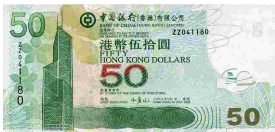
50 dólares Hong Kong