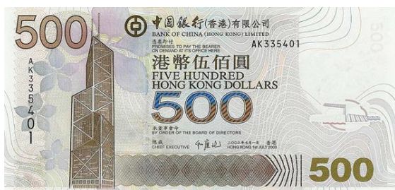
500 dólares Hong Kong