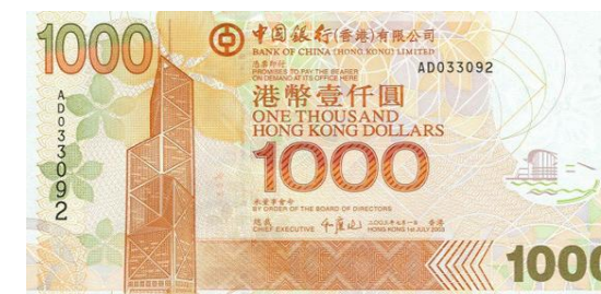
1,000 dólares Hong Kong